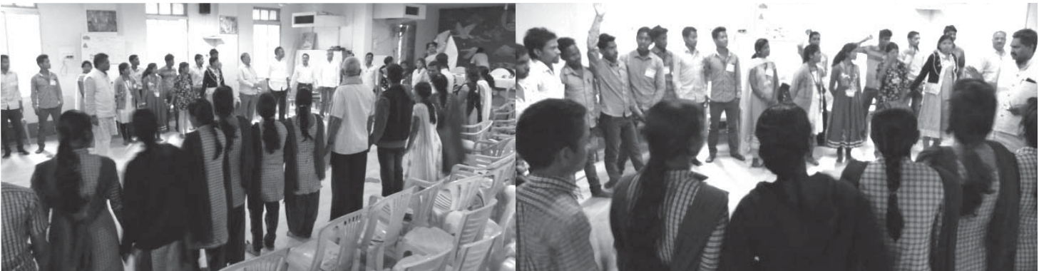
ନିର୍ମାଣ ଶ୍ରମିକ ପିଲାଙ୍କ ସ୍ୱତନ୍ତ୍ର ଅଧିବେସନ