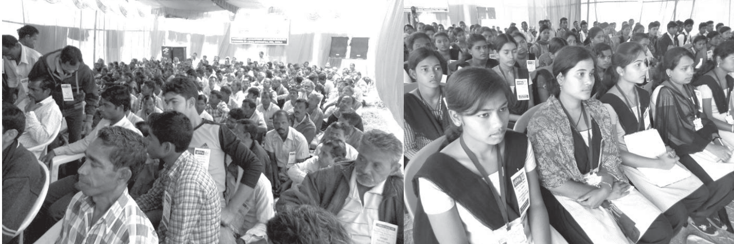
ଛାତ୍ର ଛାତ୍ରୀ ଙ ସମାରୋହରେ ଅଭିଭାବକ ପର୍ଯ୍ୟବେକ୍ଷକ ଭାବରେ ଯୋଗଦାନ